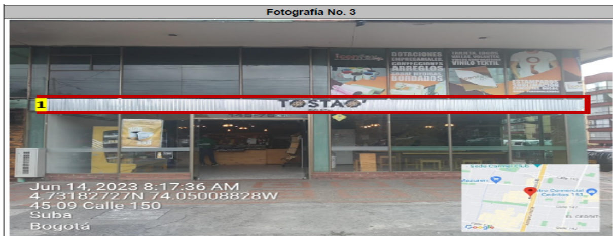
Fachada con orientación visual hacia la AK 45, en la que se puede evidenciar: (1) elemento publicitario tipo "aviso en fachada" instalado sin registro ante la Secretaría Distrital de Ambiente.