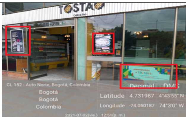
Foto del establecimiento donde se identificaron: (3) afiche-carteles en ventanas.