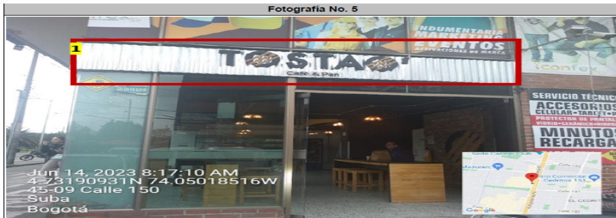
Fachada con orientación visual hacia la CL, en la que se puede evidenciar: (1) elemento publicitario tipo "aviso en fachada" instalado sin registro ante la Secretaría Distrital de Ambiente.