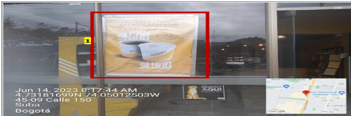
Fachada con orientación visual hacia la AK 45, en la que se puede evidenciar: (1) elemento tipo publicitario incorporado en la ventana.